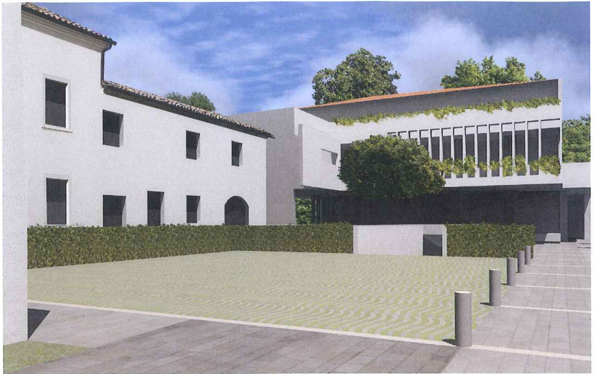
vista da ingresso pedonale e carrabile dal Terraglio