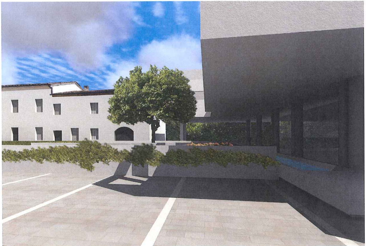
vista da ingresso pedonale dalla corte pubblica